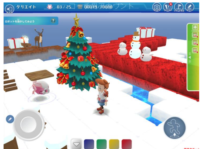
「プログラミング教育 HALLO」のプログラミング教材『Playgram™』に新フィールド「ゆきだるま」が登場！