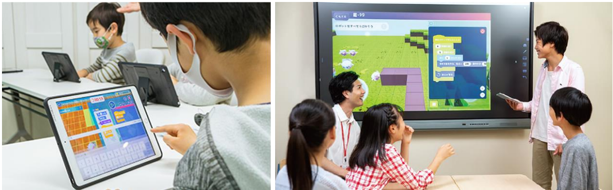
HALLO での週 1 回のプログラミングレッスン風景（左）、月 1 回の発表風景イメージ（右）

生徒は各々でフィールドを選び創作した作品を、HALLO のレッスン内で月 1 回発表します。プレゼンテーション力や課題発見力、論理的思考力、課題解決力など 21 世紀に必要とされるスキルも育めるのが HALLO の特長です。