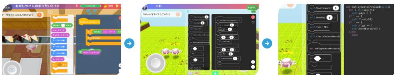
ビジュアル言語【日本語】（左）からビジュアル言語【Python】（中央）、テキストコーディング【Python】（右）へと 実用レベルまで無理なくステップアップできる「ミッションモード」