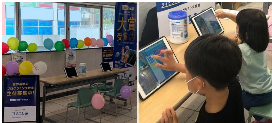
「プログラミング教育 HALLO」プチ体験会の様子

また、「HALLO プチ体験会」の会場から最寄りの、HALLO センター南校（神奈川・横浜市）では、今月（2023年1月）中にご入会いただいた先着8名さまに限り、入会金22,000円（税込）が無料になるキャンペーンを実施中。教室見学や無料体験授業もお申込みを受け付けています。