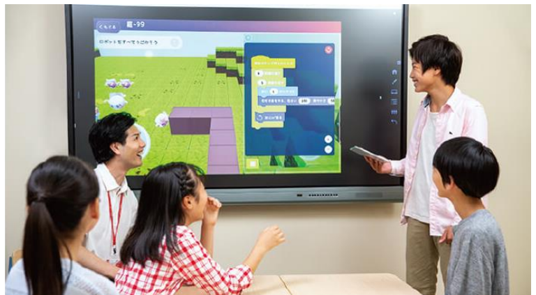
HALLO での週 1 回のプログラミングレッスン風景（左）、月 1 回の発表風景イメージ（右）