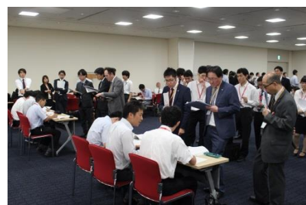
全国10会場で行われた地方予選